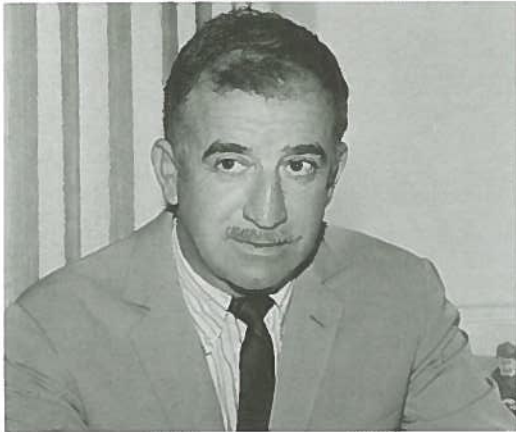
Don Siegel