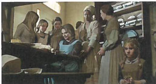
Les Protes de Don Siegel (1971) – Universal.